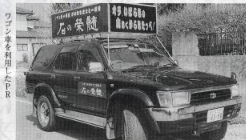
ワゴン車を利用したPR