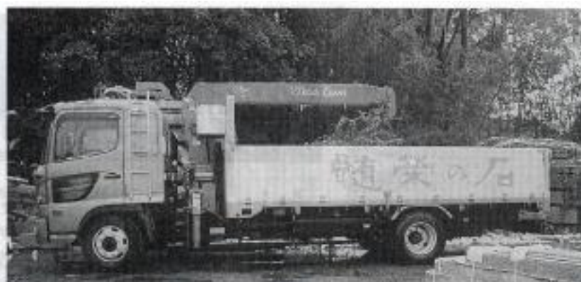
ポディー一杯に髓榮の石と描かれ人目を引く

宣伝カーには「世界一とは言わないが、日本一だっべ」「おら、いばらきの山おくからきたっべ」など茨城弁の文字が書かれ、人目を引いている。取引業者の中には、この車を見ると